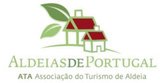
ATA Associação do Turismo de Aldeia